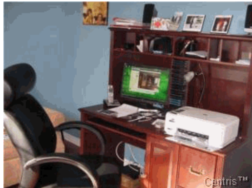
Bureau à domicile